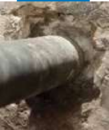
Выполнение штрабы вокруг трубы