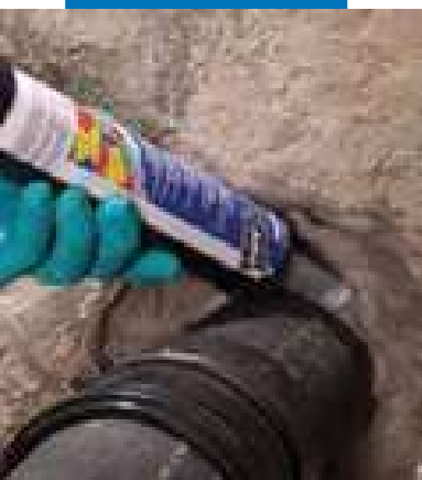
Нанесение Marerproof Swell вокруг трубы