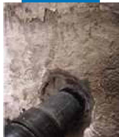
Maperproof Swell после нанесения

Содержащиеся в настоящем руководстве указания и рекомендации отражают всю глубину нашего опыта по работе с данным материалом, но при этом их следует рассматривать лишь как общие указания, подлежащие уточнению на практическом опыте. Поэтому, прежде чем широко применять материал для определенной цели, следует проверить его на адекватность, предусмотренному виду употребления, принимая на себя всю полноту ответственности за последствия, связанные с применением этого материала.