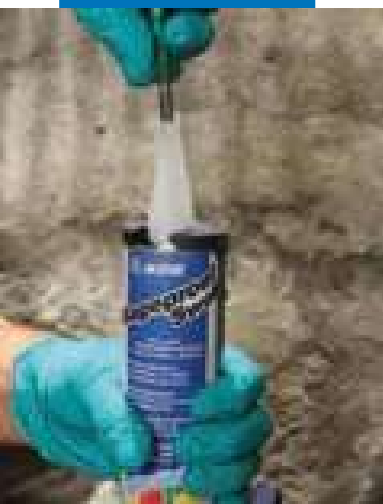
Прокалывание защит- ной мембраны на трубе Marerproof Swell